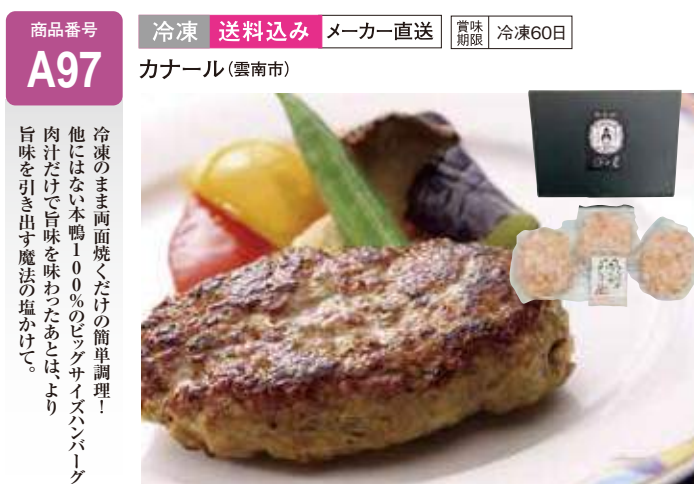
A97 塩で食べる本鴨ハンバーグ3人前 ..... 5,130円 (送料込み) 本鴨ハンバーグ180g×3、カナールの塩小袋5g