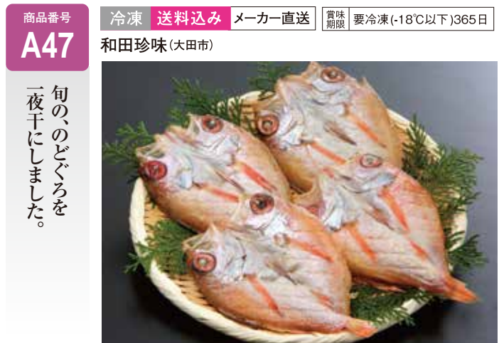
A47 のどぐろ一夜干 ..... 5,940円 (1尾：81~90g)×4尾 (送料込み)