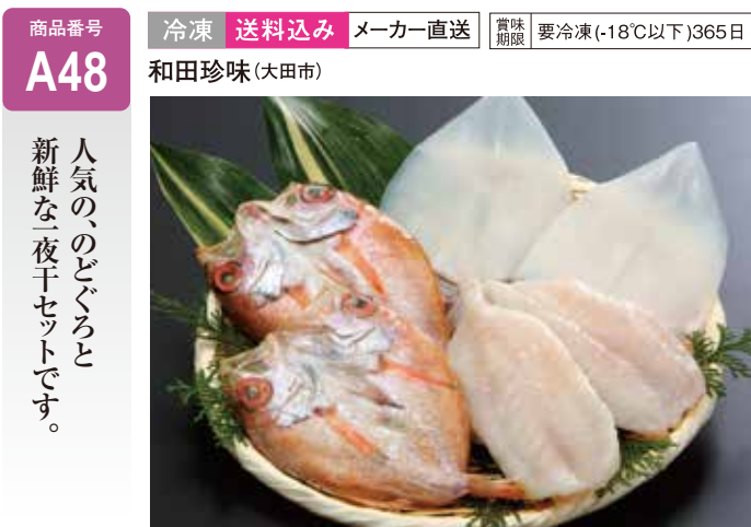
A48 ふぐ・白いか・のどぐろ一夜干 ..... 5,940円 ふぐ2尾、白いか2枚、のどぐろ2尾 (送料込み)