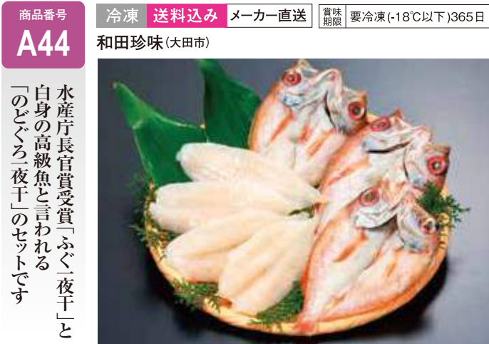
A44 ふぐ・のどぐろ一夜干 ..... 5,940円 ふぐ4尾、のどぐろ3尾 (送料込み)