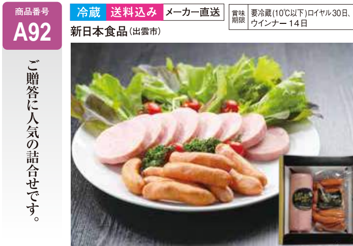
A92 出雲ハム詰合せ ..... 5,700円 (送料込み) 出雲ハムロイヤル450g、粗挽きウインナー350g