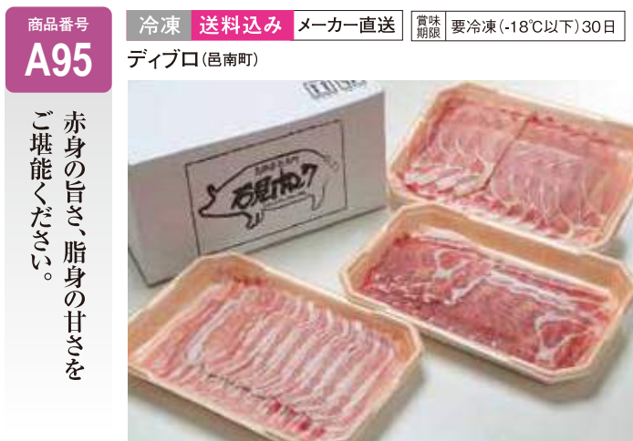
A95 石見ポークしゃぶしゃぶセット ..... 6,000円 (送料込み) パラしゃぶ400g、ロースしゃぶ400g、肩ロースしゃぶ400g