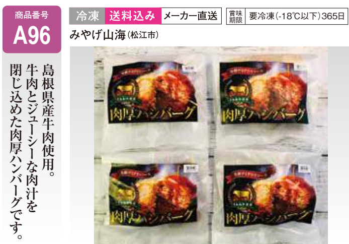
A96 しまね和牛肉厚冷凍ハンバーグ ギフト ..... 5,400円 (送料込み) 200g×4個(固形量120g×4個)