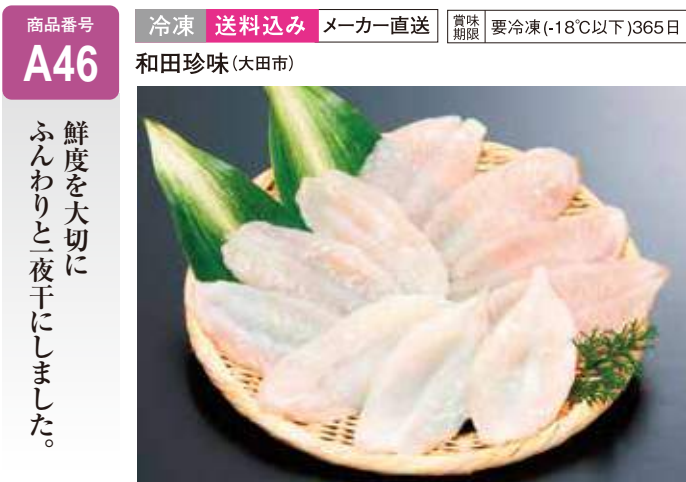
A46 ふぐ一夜干 ..... 5,400円 420g (送料込み)