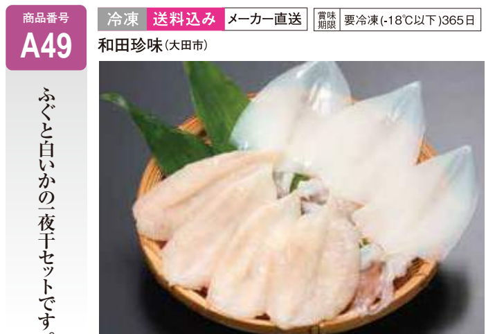
A49 ふぐ・白いか一夜干 ..... 5,940円 ふぐ4尾、白いか3枚 (送料込み)

冷蔵 送料込み 冷蔵 送料別 は冷蔵便で、冷凍 送料込み は冷凍便でお送りします。