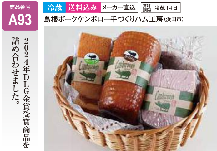
A93 ケンボロー ハム・ソーセージセット ..... 7,000円 (送料込み) ネットロースハム(500g)・ベーコン(180g)・フライッシュケーゼ(200g)