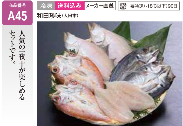
A45 みちしお ..... 5,940円 ふぐ一夜干2尾、のどぐろ一夜干2尾、えてかれい一夜干2尾、あじの開き2尾 (送料込み)