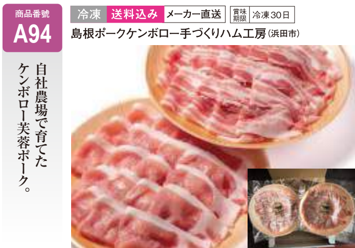
A94 ケンボロー芙蓉ポークしゃぶしゃぶセット ..... 4,700円 (送料込み) 芙蓉ポーク ロース肉350g、芙蓉ポーク パラ肉350g